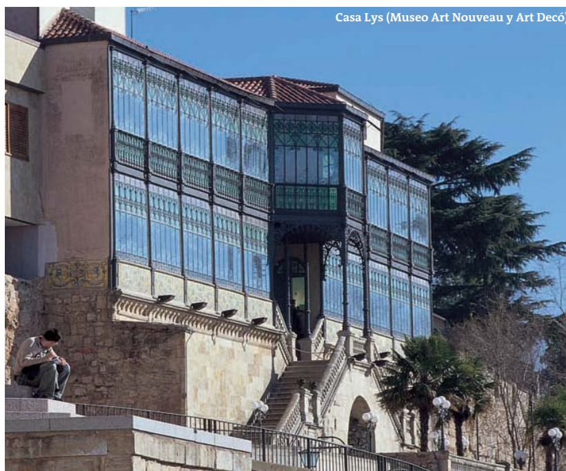
Casa Lys (Museo Art Nouveau y Art Decó)