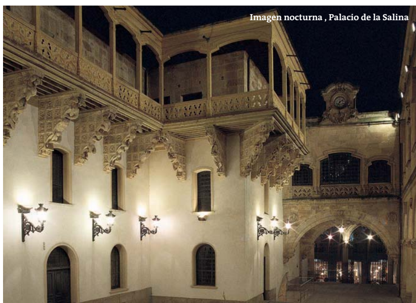
Imagen nocturna, Palacio de la Salina

ciega. La Casa de las Conchas (***) es uno de los símbolos universales de la ciudad. Su construcción se desarrolló entre 1495 y 1517 por impulso de Rodrigo Arias Maldonado. Circula en Salamanca, desde antaño, el rumor de que bajo alguna de sus 400 conchas se esconde una de oro. Nadie ha intentado, afortunadamente, comprobarlo. Cuenta con patio porticado de dos alturas, desde el que se disfrutan vis-