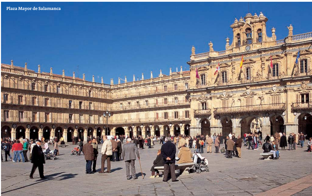
Plaza Mayor de Salamanca

Una ciudad bendecida por semejante lujo arquitectónico debía exhibir una gran catedral. Salamanca tiene dos, para que no exista duda de su condición de Museo Urbano de la Arquitectura. La Catedral Vieja (***) comenzó a edificarse a comienzos del siglo XII, bajo la advocación de Santa María de la Sede. Su estructura resultó parcialmente engullida por obras posteriores. Conservó, no obstante, la planta primigenia de cruz latina con tres naves, transepto y cabecera que en origen tenía triple corona absidial. Su componente más destacado es la Torre del Gallo –toma su nombre de