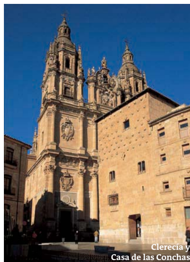
Clero y Casa de las Conchas

San Esteban (***) es otra de las deslumbrantes joyas arquitectónicas de Sala-