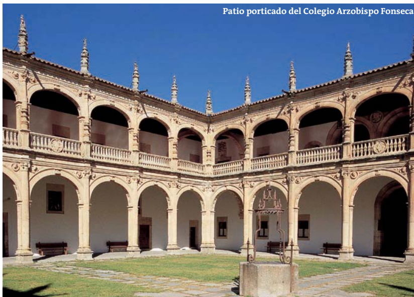
Patio porticado del Colegio Arzobispo Fonseca

manca. Su dilatada edificación, entre 1524 y 1610, dio lugar a la renovación de estilos, desde un gótico transitivo hasta un incipiente barroco, que se aprecia en su fábrica. El plateresco propio de sus años iniciales predomina en la fachada y estructura central de la iglesia, mientras el barroco se asoma a la sacristía. Este conjunto dominico, de belleza extraordinaria, cuenta con nada menos que tres claustros –«de los Reyes», «de Colón» y «de los Aljibes»–. El retablo mayor de la iglesia conventual ha sido catalogado como obra maestra de José de Churriguera.