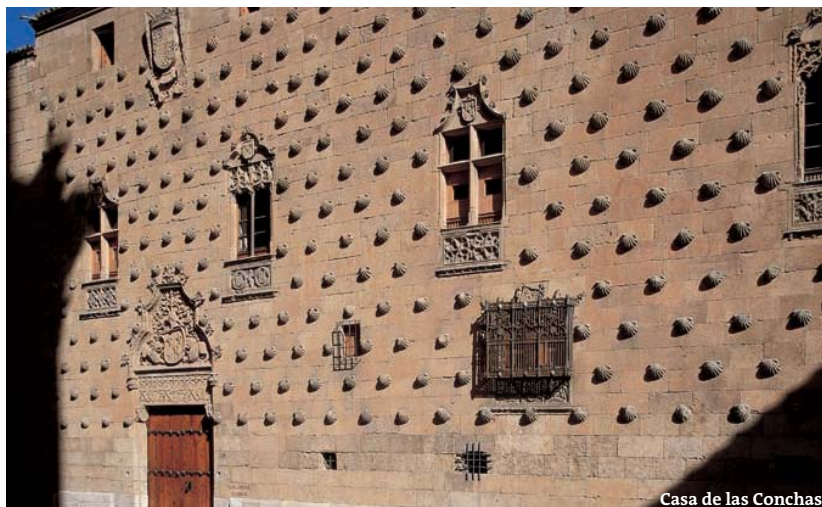
Casa de las Conchas