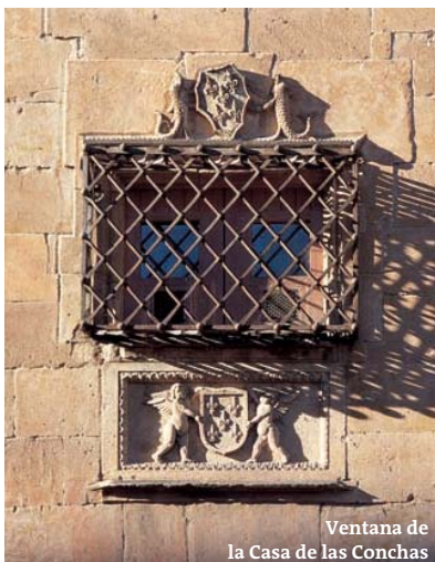
Ventana de la Casa de las Conchas