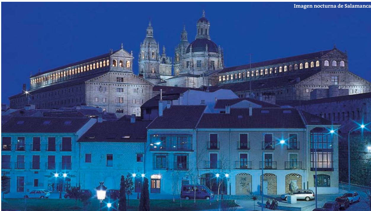
Imagen nocturna de Salamanca

Herederos de los apellidos de las familias más influyentes –Álvarez-Abarca, Maldonado, Solís, Rodríguez del Manzano, Arias Corvelle...– los palacios inundan la ciudad. Esta arquitectura palaciega aparece frecuentemente guarnecida con componentes defensivos de los que nos han llegado interesantes muestras. Las Torres del