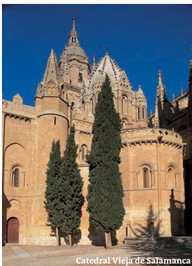
Catedral Vieja de Salamanca

La producción del Pleno Medioevo dejó en Salamanca muestras de notable interés. La iglesia de San Marcos (***) se edificó en el siglo XII junto a la muralla nueva de la ciudad. Su planta circular obedece a un diseño ciertamente inusual en el ideario románico. Decoró sus paredes interiores con interesantes pinturas góticas del siglo XIV. La veterana iglesia de San Martín (***) – fechada en 1103– ha sufrido múltiples alteraciones. Conserva la portada original, que se engalana con arquivoltas lobuladas. El interior ofrece diversos alicientes, entre los que destacan la decoración del coro y sus escaleras de acceso, y el retablo mayor, que Churriguera había tallado en 1731 para la Iglesia de San Sebastián. Caballeros de la Orden de San Juan de Jerusalén impulsaron, hacia 1139, la edificación del templo de San Juan Bautista de Barbalos (*), desde cuya tribuna predicaba San Vicente Ferrer. Santo