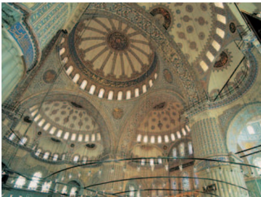
Interior de la Mezquita Azul. Página derecha: Mezquita de Solimán.