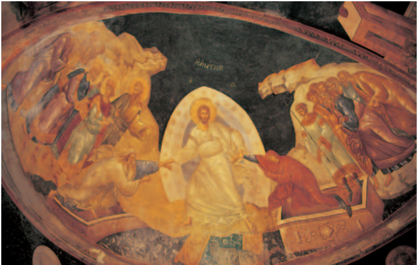
Fresco del monasterio de Chora.