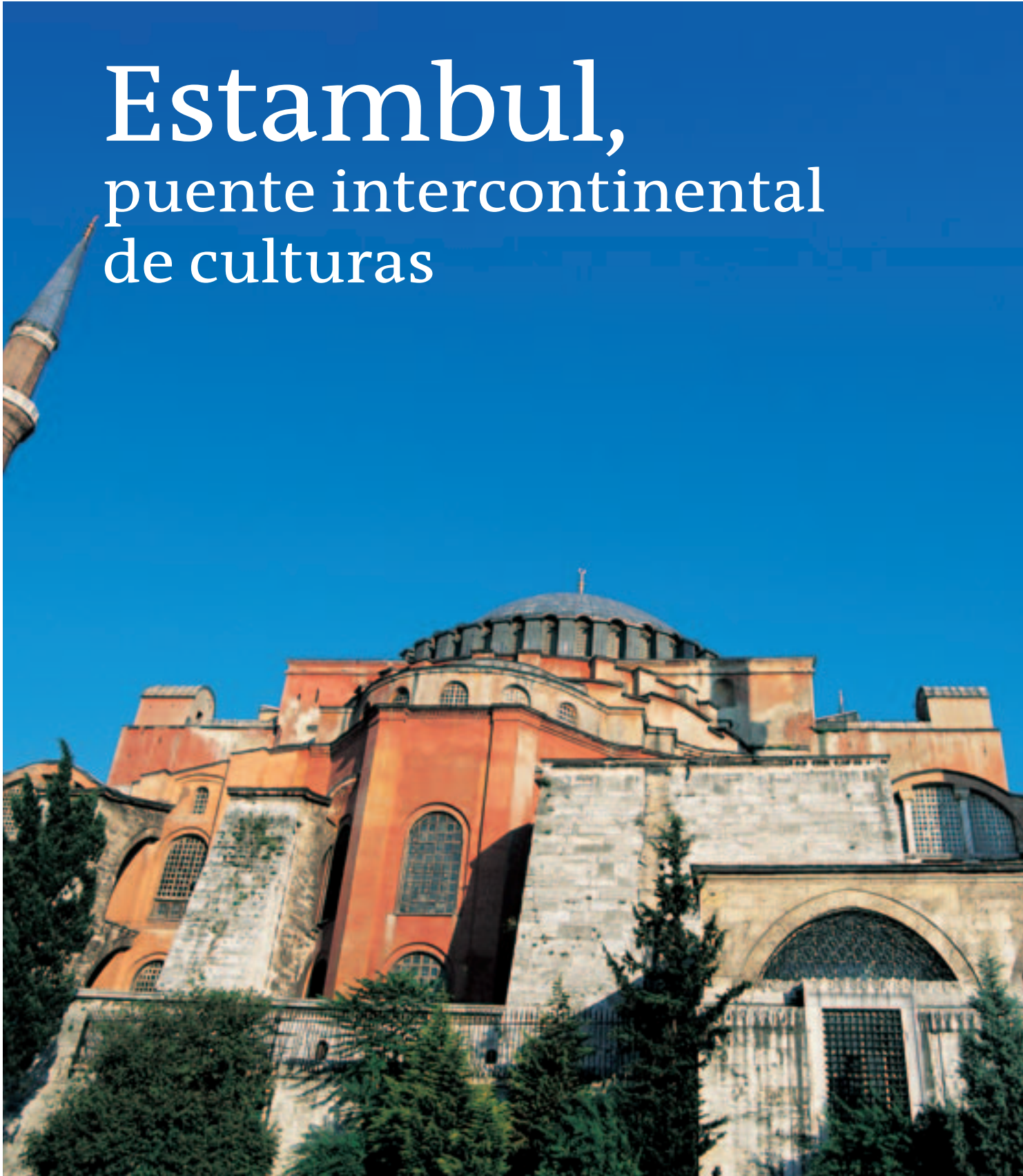
Santa Sofia -Aya Sofia-