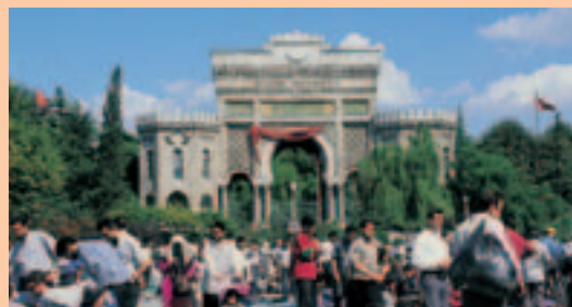
Puerta de la Universidad de Estambul.

Leyenda: (*) interesante, (**) muy interesante, (***) imprescindible