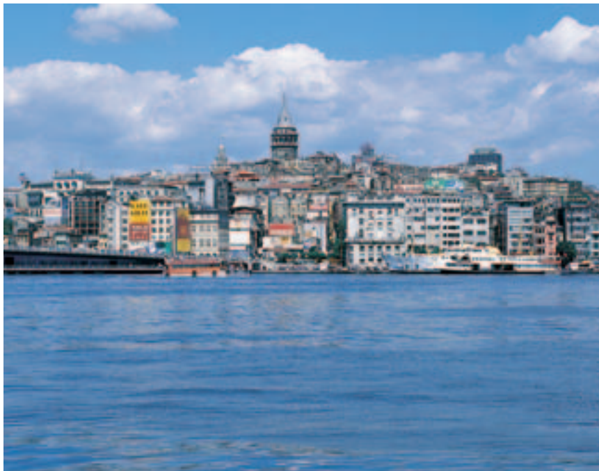
Panorámica de Estambul.

flanquean las orondas cúpulas de las bellísimas mezquitas. Quizá las más conocidas y representativas sean las de Sultanahmet (***) –llamada también Mezquita Azul por el componente predominante de esta coloración en los finísimos azulejos que recubren sus paredes interiores– y la de Suleymaniye (**), encargada por