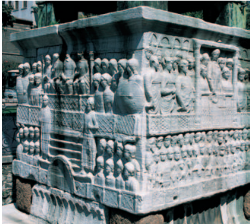
Hipódromo. Basamento de la columna de Teodosio.

Pero, sin duda, el gran activo patrimonial de Estambul es su trepidante vitalidad. La actividad comercial destaca sobre cualquier otra en una ciudad en la que un verdadero hormiguero humano debe buscar cada día su sustento, bajo el signo de la síntesis étnica y cultural. La bulliciosa ciudad explota en agitación tanto al aire libre como en el laberinto techado del Gran Bazar (***), el mayor centro comercial del mundo que aglutina miles de establecimientos desde los que se intenta llamar la atención