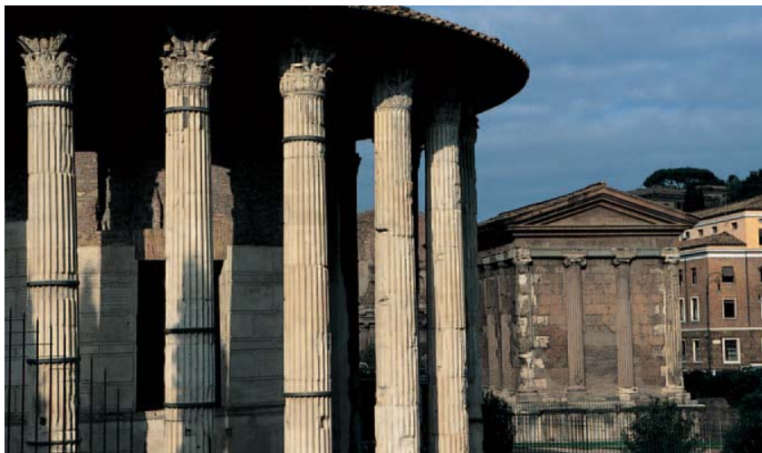
Templos –Hércules y Portuno– del Forum Boarium.

Quien crea haber contemplado las más exquisitas obras de arte del mundo sin haber visitado la Galería Borghese (***) tiene aún una asignatura pendiente en este maravilloso reducto de la exaltación artística. Bernini dejó aquí muestra de su virtuosismo. Lo comprobaremos al contemplar como los dedos del raptor Plutón se hunden en la mármorea carne de Proserpina. Las horas que el visitante dedique a recorrer este museo de la belleza quedarán grabadas como uno de los más imborrables recuerdos romanos. Roma ha ejercido como capital milenaria de la cultura, y la consecuencia de esta vocación se deja ver en la inagotable relación de colecciones artísticas, agrupadas por familias pudientes, que esconden sus viejos palacios, algunos de los cuales abren hoy sus puertas al visitante. En la Galería Pamphilj (**) podremos rastrear una interesante