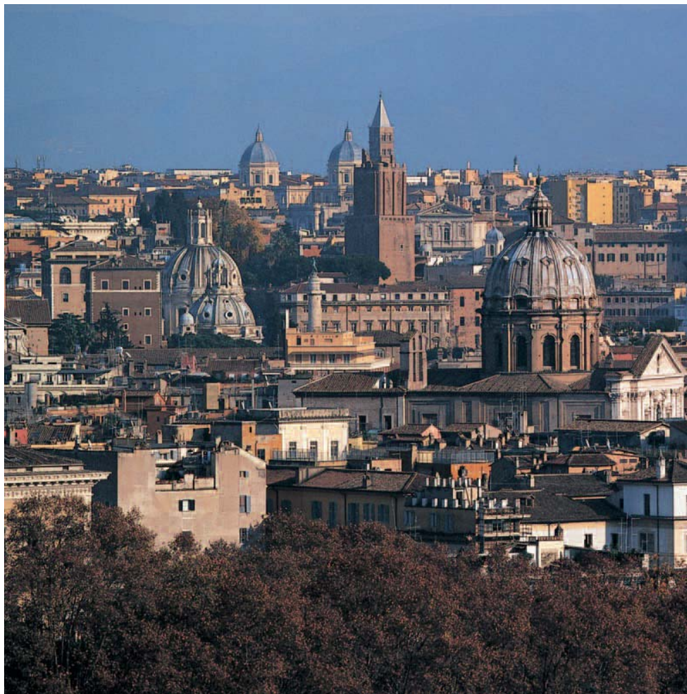
Panorámica de Roma desde Plaza Garibaldi.

El caminante más esforzado tiene en Trastevere y Gianicolo dos referencias inexcusables para captar el alma de la otra cara de la ciudad. Proponemos un largo y placentero paseo que permite disfrutar de rincones periféricos de innegable atractivo. Con motivo de la visita a la Piazza della Bocca della Verità, y una vez nos hayamos recreado en la contemplación de motivos de interés tan notables como el Arco de Jano, los templos del Foro Boarium o la espléndida iglesia de Santa María in Cosmedian, y acaso cumplido el trámite de comprobar cuánto tiene de verdad la leyenda que asegura que quien introduzca la mano en la famosa Bocca de la Verdad se cerrará despiadadamente sobre quien tenga alguna infidelidad pendiente de justificar, podremos ingresar en la barriada del Trastevere (**) a través del Ponte Palatino, desde el que se obtienen bellas vistas del Ponte Rotto (**) e isla Tiberina. Tras obligada detención en la plaza de Santa María (**), la parte más exigente del trayecto nos obliga a ascender hasta San Pietro in Montorio, donde el