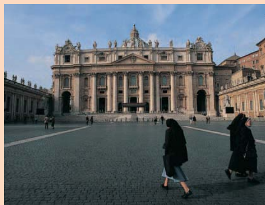
Basilica de San Pedro.

Legenda: (*) interesante, (**) muy interesante, (***) imprescindible