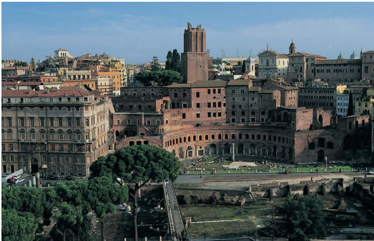
Panorámica del Foro de Trajano desde Il Vittoriano.

dotar a Roma de espectaculares estructuras urbanísticas –aunque alguna de sus ideas resultase tan peregrina como la propuesta de desvío de un tramo del río Tíber–. El periodo del Imperio llega de la mano de Augusto con ansias de pacificación. Para conmemorar la implantación de la Pax Augusta, tras las batallas del Mediterráneo, se erigió el Ara Pacis (**), cuyas inacabables tareas de restauración ocasionan en el visitante la frustración de no poder contemplar a plena satisfacción uno de los más emblemáticos vestigios de la historia de la ciudad. No obstante, la oferta del catálogo de joyas arquitectónicas correspondiente a la etapa Imperial resulta inagotable. Tras asomarnos a los miradores que se abren sobre el Foro (***) y la Columna de Trajano (**), podremos caminar por las desgastadas calzadas del Foro Romano (***) y ascender hasta la plataforma del Palatino (***) para retroceder idealmente en el tiempo hasta imaginar episodios de la época. Huroneando en las laberínticas entrañas del ciclópeo Coliseo (***) reme-