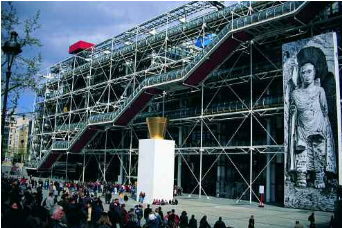
Centro Georges Pompidou

co se disfrutaban espléndidas vistas del corazón de París. Muy cerca se instaló el cementerio de Montparnasse, cuyos impactantes monumentos funerarios concitan la atracción de muchos turistas, sin que la sensación de mal fario escatológico que suelen producir en las modernas conciencias occidentales este tipo de lugares parezca frenar la curiosidad de los visitantes.