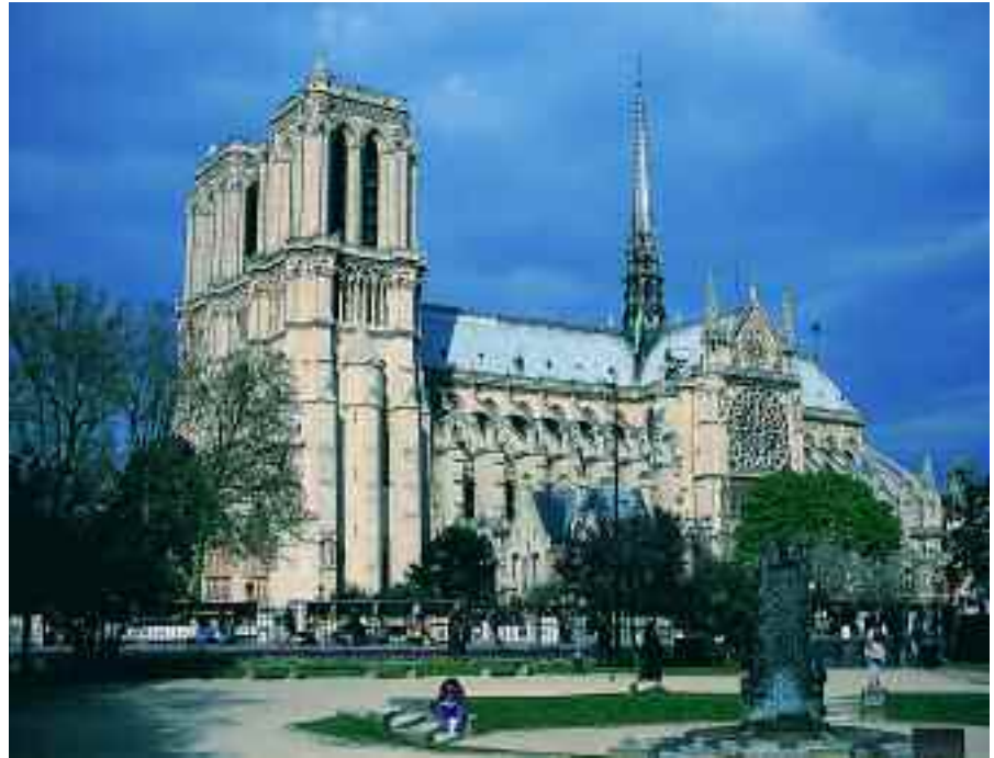
Catedral de Notre-Dame

como Notre Dame , la Sainte-Chapelle , la Conciergerie o el Palacio de Justicia. La catedral metropolitana es obra justamente celebrada y paradigma del arte gótico. Sus obras se iniciaron en la segunda mitad del siglo XII, a instancia del obispo Mauricio de Sully, y requirieron dos siglos de arduos trabajos, que se vieron recompensados con la consecución de una excelsa obra maestra. El declinar del sol al atardecer bruñe el imafrente del templo, que adquiere un espectacular tono encendido. Es un buen momento para asom-