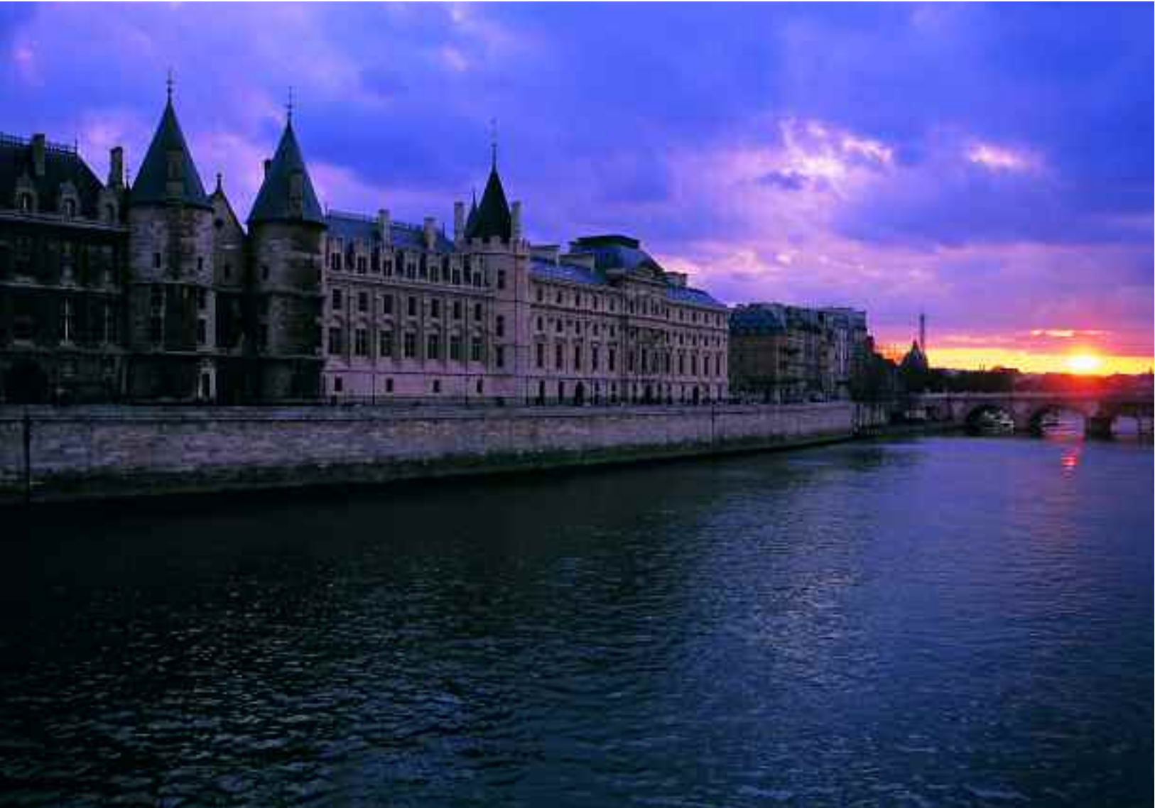
Atardecer junto al río Sena

fente al Pont D'Iena , se alza el Palacio de Chaillot, que culminan desde elevado oteadero los jardines del Trocadero. Alberga varios museos y ofrece vistas incomparables sobre la Torre Eiffel y los contiguos jardines del Parc du Champ de Mars , que invitan a caminar sosegadamente.