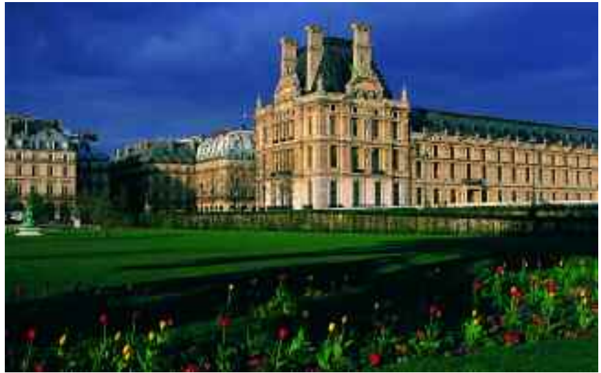
Museo del Louvre

La avenida de los Campos Elíseos prolonga el eje longitudinal de París, en dirección noroeste, hasta el Arco del Triunfo cuyo proyecto ideara Napoleón, para terminar consolidándose como sede de homenaje a muchos soldados desconocidos cuyas vidas cobró como tributo la primera guerra mundial. La avenida de la