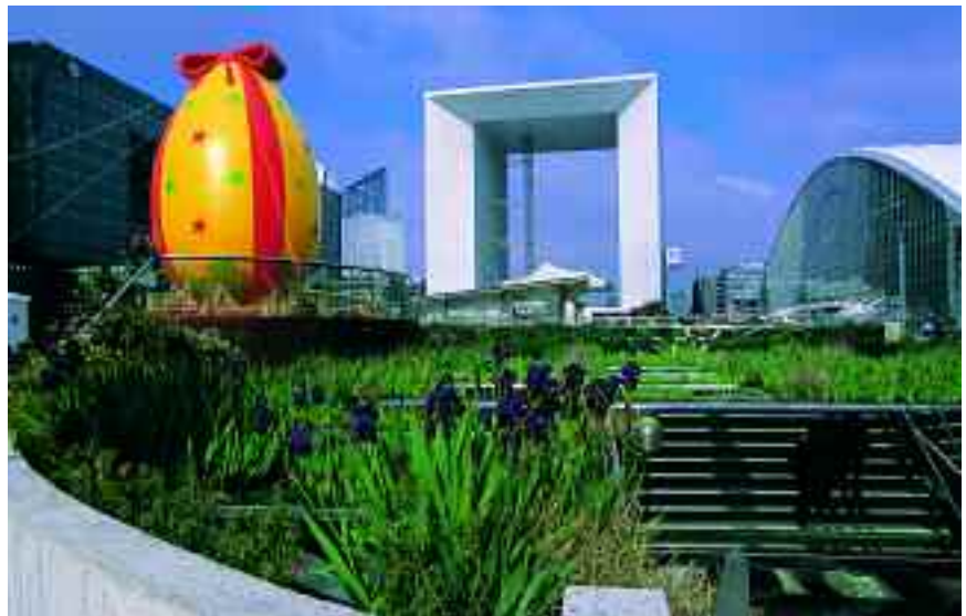
Grande Arche de la Défense

Grande Armée da continuidad al gran eje parisino y, dejando atrás el octavo distrito, desemboca en el moderno complejo que rodea al Gran Arco de la Defensa, cuyo alto mirador, a más de un centenar de metros sobre el nivel del asfalto, regala extraordinarias vistas de París.