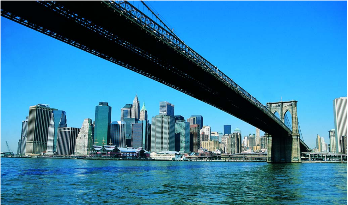
Manhattan Downtown. Puente de Brooklyn

y para entender eso que llaman el «estilo de vida americano». Lo comprenderá el viajero al contemplar a centenares de niños blandiendo sus bates de béisbol esperando alcanzar la efímera recompensa de la alabanza paterna cuando consiga conectar, con fuerza, con la bola. Todo en Nueva York se mide en clave de triunfo o fracaso, y la competitividad alcanza hasta a los niños de corta edad. Para un europeo resultará chocante ver el desolador abandono en que rumia su fracaso el perdedor, mientras quien ha acertado en la suerte deportiva recibe parabienes de todos.