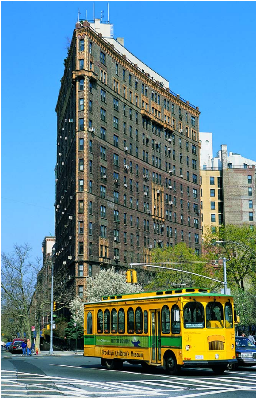
Grand Army Plaza. Brooklyn

porticadas en dos alturas, su escalera, salón principal y artesonado!- del castillo malacitano de Vélez Blanco, que viajó desmembrado al otro lado del Atlántico, del mismo modo que lo hicieron muchas obras de la genial creación del Medioevo castellano o catalán. El Metropolitan tiene un brazo desgajado ubicado en el Fort Tryron Park,