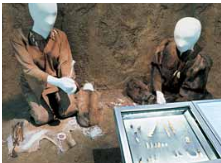
Museo de Altamira: la exposición permanente. «Los Tiempos de Altamira».