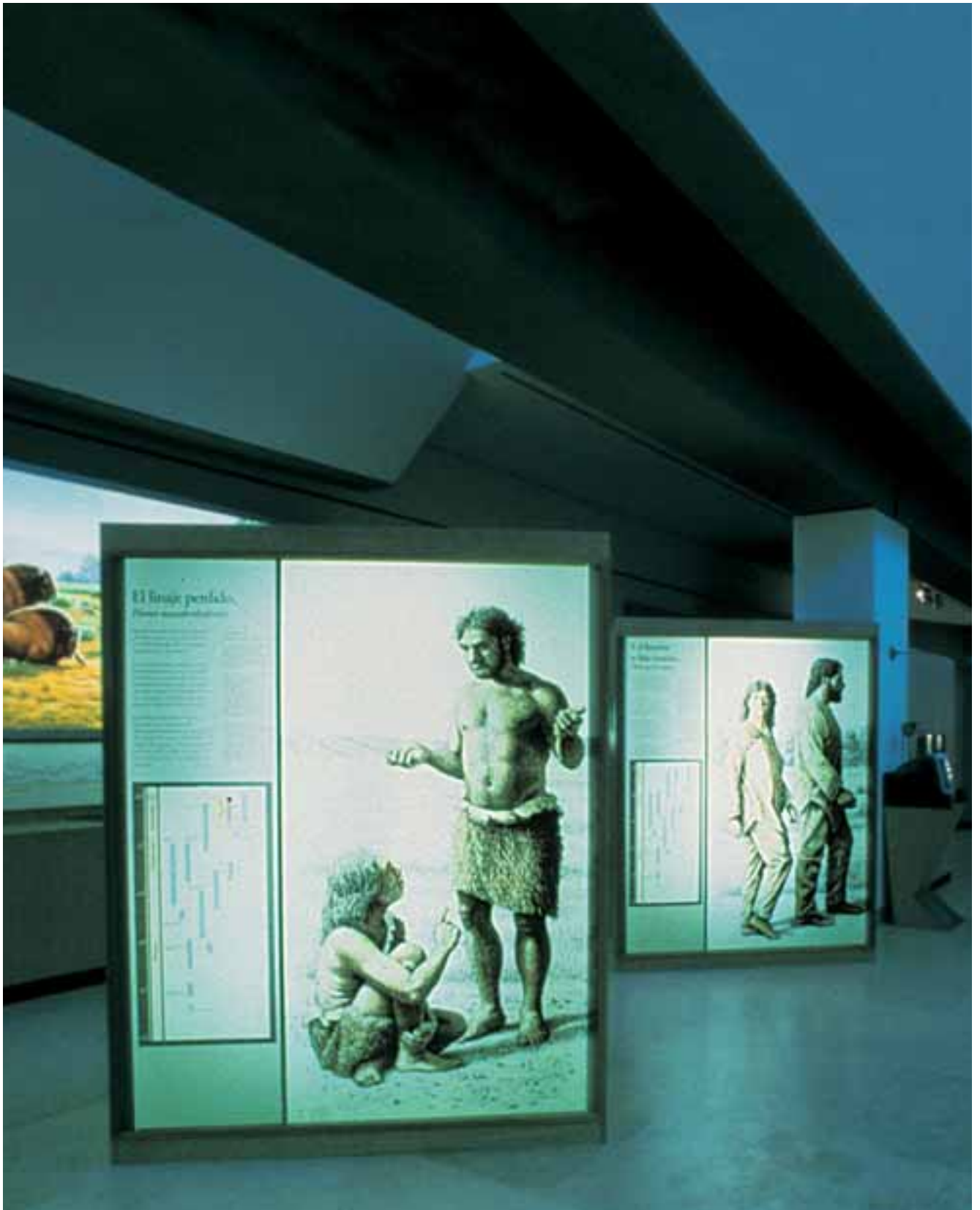
Museo de Altamira: la exposición permanente «Los Tiempos de Altamira».