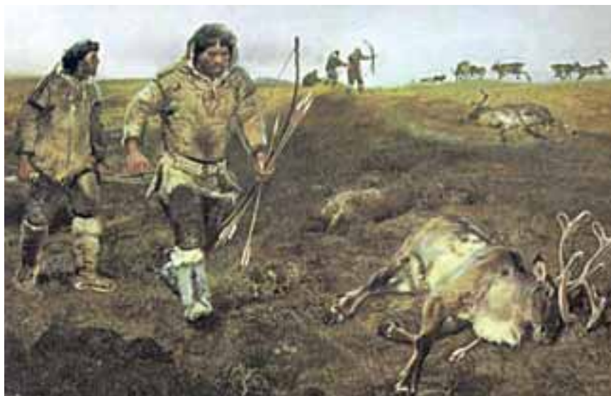
© Herederos de Zednek Burian. Praga

Ocho mil quinientas personas al año pueden acceder a la cueva de verdad. Si usted tiene paciencia puede entrar en la rigurosa lista de espera y probablemente dentro de tres años reciba la nota con el día y hora de su