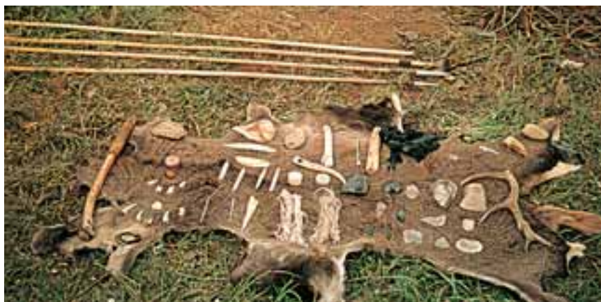
Museo de Altamira: neoutiles para talleres de tecnologías prehistóricas.