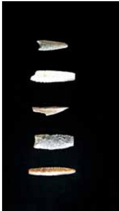
Museo de Altamira: puntas solutrenses