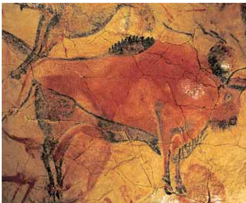
Museo de Altamira: la Neocueva, bisontes policromos