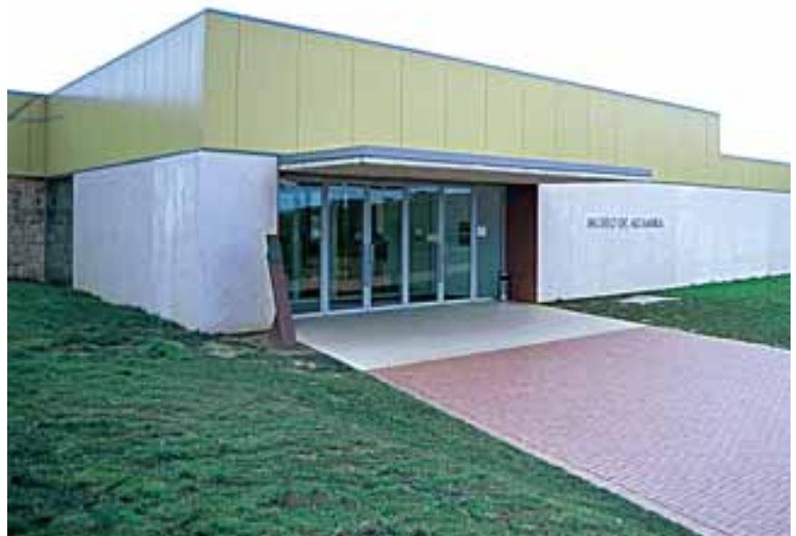
Museo de Altamira

contemporaneidad, aquí viene, hoy, gente de todos los puntos del planeta, la ciudad vive una realidad cosmopolita propia de la nueva sociedad mundial del conocimiento. Un museo digno del siglo XXI.