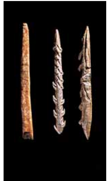
Museo de Altamira: arpones